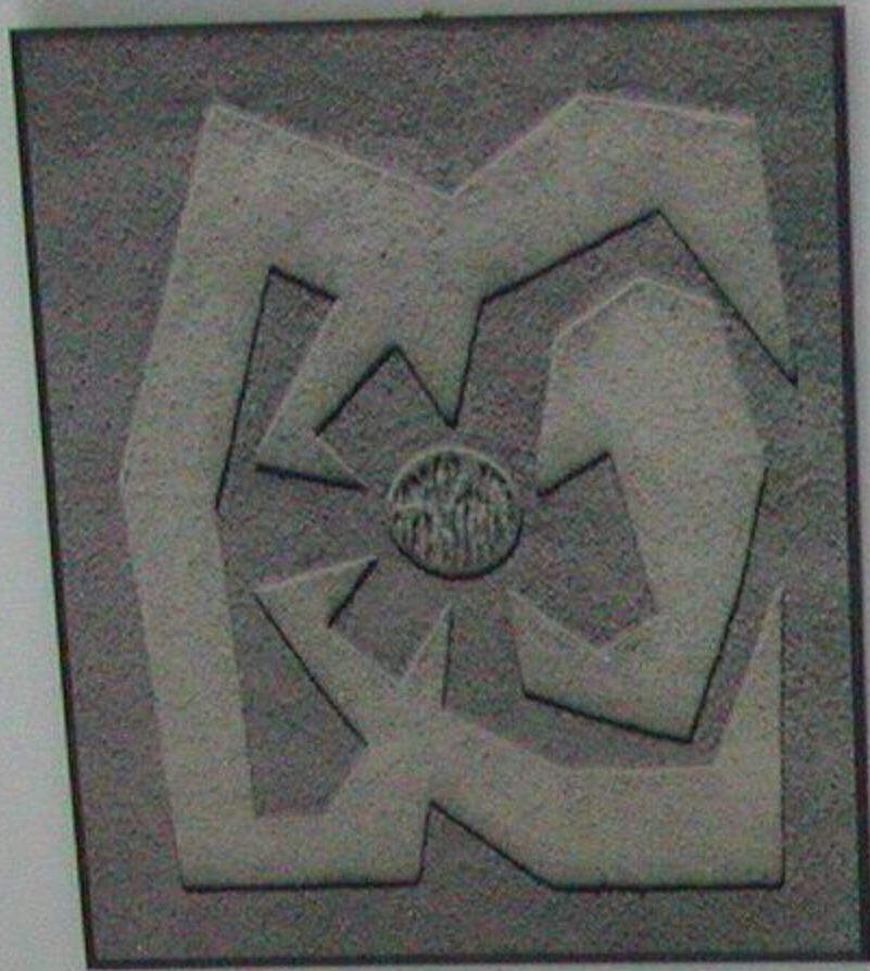
Vilho Kivila, Kuvio II, 1972, paper, edition 100, signed and numbered.